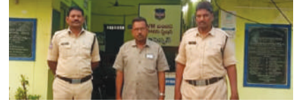
పెనుబల్లి, కెరటం న్యూస్

కేంద్రానికి సమీపాన ప్రతిపాదిత విమానాశ్రయం ఏర్పాటు ప్రక్రియను మరింత వేగవంతం చేయాల్సిందిగా వారు మంత్రిని కోరారు. సింగరేణి సంస్థ ప్రధాన కార్యాలయంతో పాటు నవభారత్, ఐటీసీ, పలుగురూ హెవీ వాటర్ ప్లాంట్ సహా పలు పరిశ్రమలు నెలకొన్నాయని, దక్షిణ ఆంధ్రప్రదేశ్ పేరొందిన భద్రాచలం శ్రీసీతారామచంద్రస్వామి ఆలయానికి వచ్చేపోయే భక్తులకు ఇక్కడ ఏర్పాటు చేసే విమానాశ్రయం సౌకర్యవంతంగా ఉంటుందని మంత్రి నాయుడుకు బీఆర్ఎస్ ఎంపీలు సురేష్ రెడ్డి, రవిచంద్ర, దామోదర్ రావు, పార్థసారథి రెడ్డిలు వివరించారు. అదేవిధంగా అదిలాబాద్, నిజామాబాద్ జిల్లా కేంద్రాల సమీపాన ప్రతిపాదిత విమానాశ్రయాల నిర్మాణానికి గ్రీన్ సిగ్నల్ ఇవ్వాలిందిగా ఎంపీలు కోరగా మంత్రి సానుకూలంగా స్పందించారు.