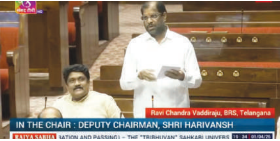
డిల్లీ బ్యూరో, కెరటం న్యూస్