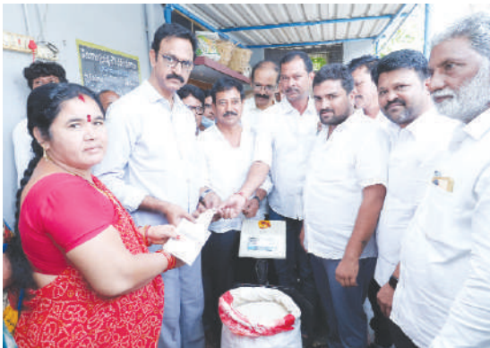
ఖమ్మం రూరల్