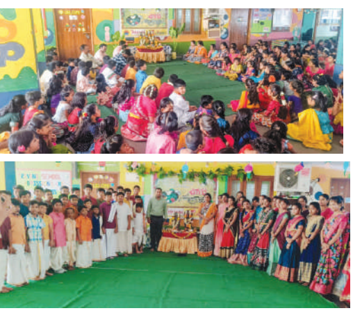
ఖమ్మం ఎడ్యుకేషన్, కెరటం న్యూస్