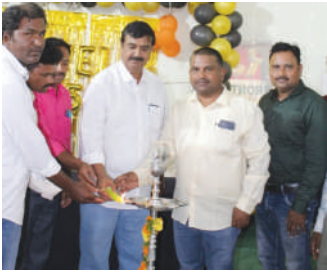
ఖమ్మం ఎడ్యుకేషన్, కెరటం న్యూస్

ఖమ్మం నగరంలోని ట్రంక్ రోడ్ ప్రాంతం లో గల ఆర్జీసీ డిగ్రీ కళాశాల గత 25 సంవత్సరాలు గా కొనసాగిస్తున్న విజయాల పరంపరను ప్రస్తుత విద్యా సంవత్సరానికి చెందిన