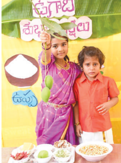
ఖమ్మం ఎడ్యుకేషన్, కెరటం స్యూస్