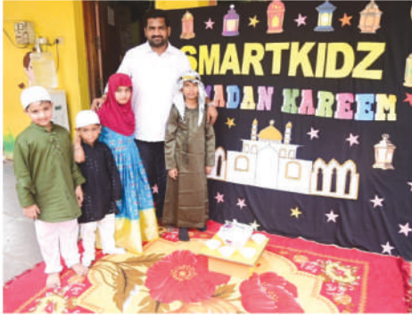
ఖమ్మం టౌన్, కెరటం స్కూల్స్