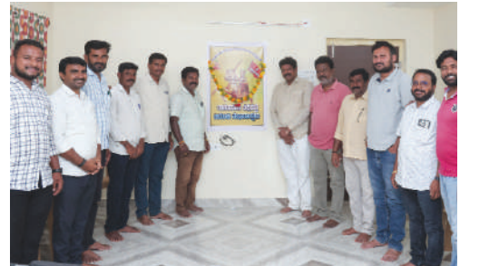
ఖమ్మం టౌన్, కెరటం న్యూస్