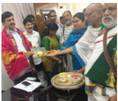
ఖమ్మం టౌన్, కెరటం న్యూస్