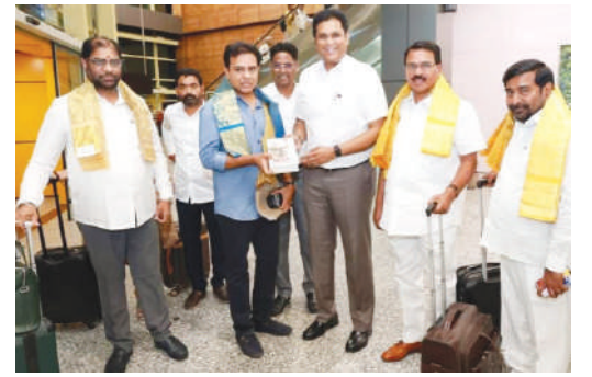
ఖమ్మం బ్యూరో, కెరటం న్యూస్