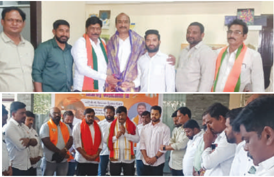
ఖమ్మం టౌన్, కెరటం న్యూస్