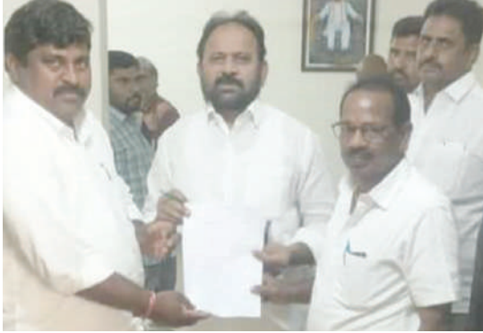
కారేపల్లి కెరటం స్కూల్ ప్రతినిధి