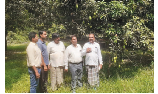
ఖమ్మం కలెక్టరేట్, కెరటం స్కూల్స్