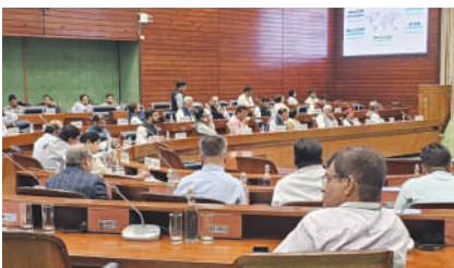
ప్రత్యామ్నాయ మార్గాలు (ఆల్టర్నెట్ యూజ్ ఆఫ్