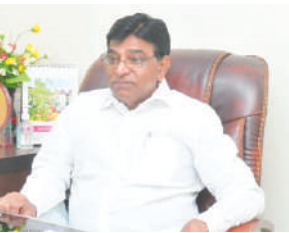
హైదరాబాద్ బ్యూరో, కెరటం న్యూస్

తొమ్మిది నెలల పాటు అంతరిక్షంలో చిక్కుకొని భూమిమీదకు చేరుకున్న భారత సంతతికి చెందిన హ్యోమగామి సునీతా