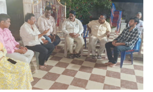
ఖమ్మం బ్యూరో, కెరటం న్యూస్