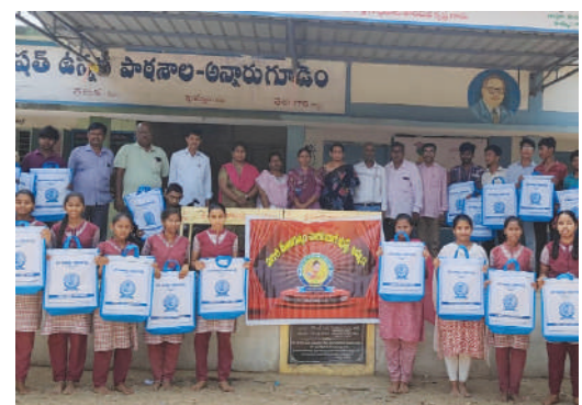
తల్లాడ, కెరటం న్యూస్ ప్రతినిధి