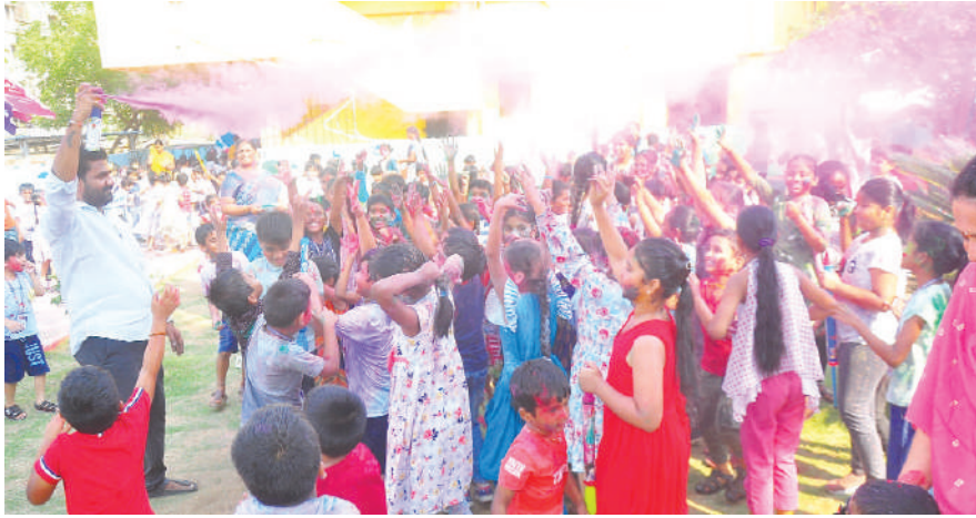
ఖమ్మం ఎడ్యుకేషన్, కెరటం న్యూస్

స్థానిక స్మార్ట్ కిడ్స్ పాఠశాలలో గురువారం హోళీ సంబరాలతో పాఠశాల విద్యార్థులు సందడి చేశారు. ఒకరికొకరు సహజసిద్ధమైన రంగులు పూసుకుంటూ ఎంజాయ్ చేశారు. పాఠశాల మైదానంలో గన్నుల్లో రంగులు నింపి తమ స్నేహితులకు రంగులు పూస్తూ సరదా