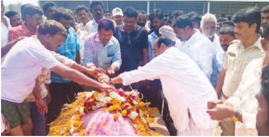
కామేపల్లి, కెరటం స్టూన్ ప్రతినిధి