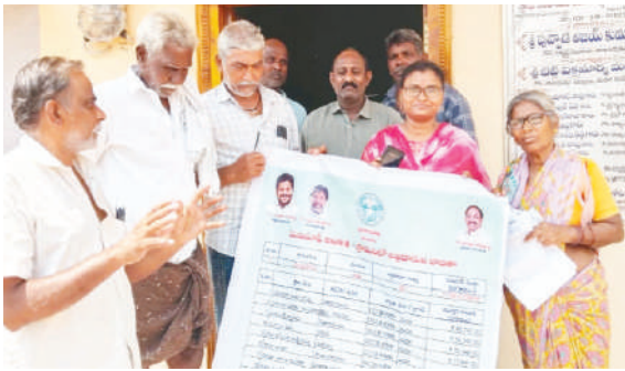
వైరా, కెరటం స్టూన్