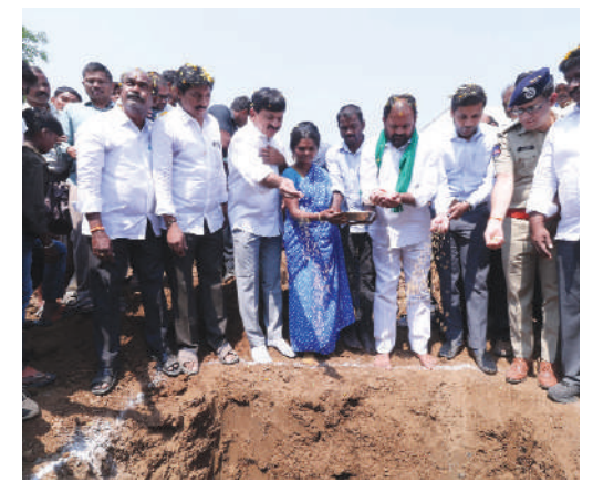
ఖమ్మం బ్యారో, కెరటం న్యూస్