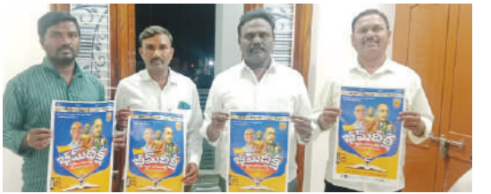
ముదిగొండ