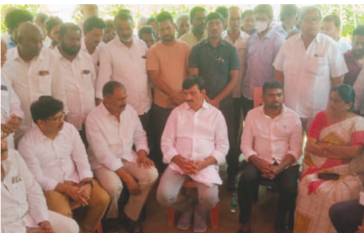
ఖమ్మం టౌన్, కెరటం స్కూల్స్