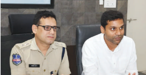
ఖమ్మం బ్యూరో, కెరటం స్కూల్స్