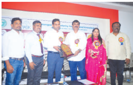
ఖమ్మం టౌన్, కెరటం స్కూల్స్ ప్రతినిధి