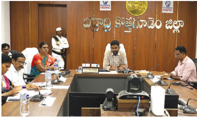
ఖమ్మం జ్యూరో, కెరటం న్యూస్

ఈనెల 27న జరగనున్న ఉపాధ్యాయ ఎమ్మెల్సీ ఎన్నికల పోలింగ్ కు అన్ని ఏర్పాట్లు పూర్తి చేసామని జిల్లా కలెక్టర్ జితేష్ వి. పాటిల్ తెలిపారు. మంగళవారం ఎమ్మెల్సీ ఎన్నికల ఏర్పాట్లపై సంబంధిత అధికారులతో ఐడిఓసి కార్యాలయం సమావేశ మందిరం