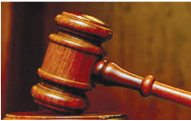
.198/2021.U/S 376AB,366,294(b),323,506,109 IPC & Sec.4, 17 of POSCO యాక్ట్ కింద కేసు నమోదు చేసిన అనంతరం విచారణ, సాక్ష్యాధారాల