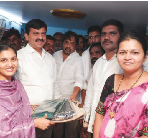
కొత్తగూడెం, కెరటం న్యూస్