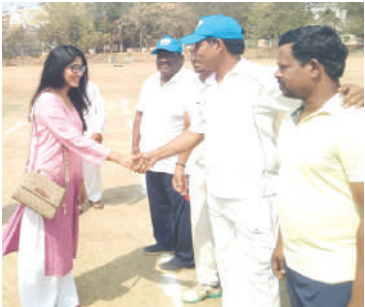
ఖమ్మం టౌన్, కెరటం స్కూల్స్