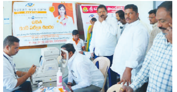
ఖమ్మం బ్యారో, కెరటం న్యూస్