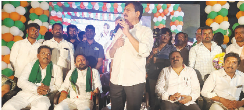
ఖమ్మం బ్యారో, కెరటం న్యూస్

సమాజ సేవలో ఎల్లప్పుడూ ముందు వరుసలో ఉండి... లక్షలాది రూపాయల సాయం అందిస్తూ... సేవల్లో ఎవరెప్పుడు