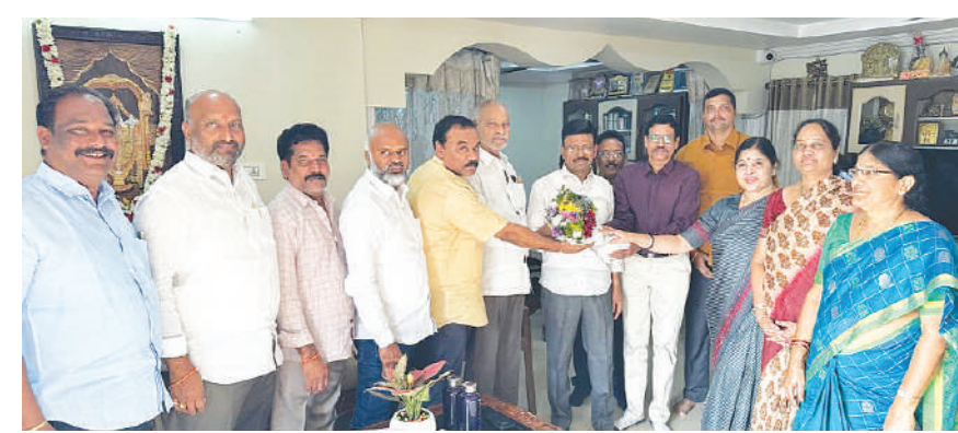
ఖమ్మం బ్యూరో, కెరటం స్కూల్స్

కమ్మ మహాజన సంఘం ద్వారా చేపడుతున్న కార్యక్రమాలను విస్తృతపరచాలని, మంచి కార్యక్రమాలు చేపట్టడం ద్వారా సంఘానికి మరింత పేరు తేవాలని ఎమ్మెల్యే తాతా మధు, మాజీ ఎమ్మెల్యే పొట్ల నాగేశ్వరరావు లు పేర్కొన్నారు. ఇటీవల ఏకగ్రీవంగా ఎన్నికైన కమ్మ మహాజన సంఘం నూతన కమిటీ ఆదివారం వారిని మర్యాదపూర్వకంగా కలిసింది. ఈ సందర్భంగా వారు మాట్లాడుతూ ఖమ్మం కమ్మ సంఘానికి దేశంలోనే మంచి పేరు ఉందని, సేవా కార్యక్రమాలు ఎక్కువగా చేపట్టడం ద్వారా దానిని విశ్వ వ్యాప్తం చేయాలన్నారు. భవిష్యత్ తరాలకు మార్గదర్శకంగా ఉండేలా సంఘం పనిచేయాలని చెప్పారు. సంఘానికి