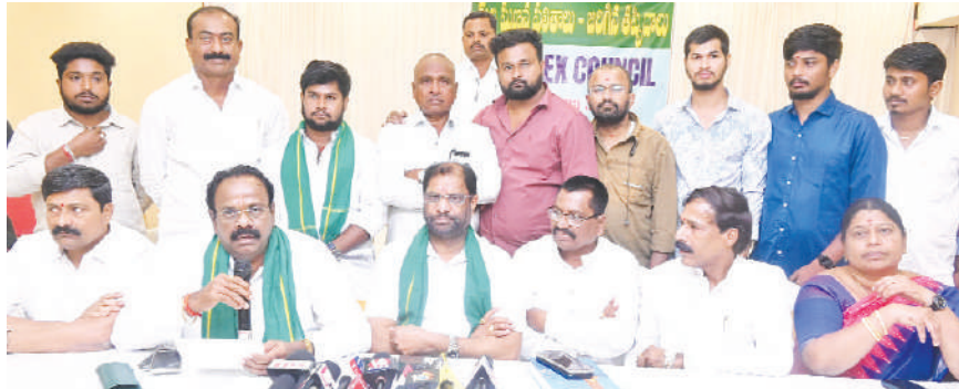
హైదరాబాద్ బ్యూరో, కెరటం న్యూస్

రాష్ట్ర ప్రభుత్వం జరిపించిన కులగణన సర్వేలో తమ సామాజిక వర్గం జనసంఖ్యను తక్కువ చేసి చూపడాన్ని మున్నూరుకాపులు తీవ్రంగా ఖండించారు. జనాభాలో అత్యధికులుగా ఉన్న తమను తక్కువ చేసి చూపి ప్రభుత్వం అవమానించిందని, అగౌరవపర్చిందని, అణచివేతకు పాల్పడుతుందని మున్నూరుకాపు ప్రముఖులు ఆందోళన వ్యక్తం చేశారు. రాష్ట్ర ప్రభుత్వం కుట్ర పూరితంగా జరిపించిన సర్వేకు వ్యతిరేకంగా హైదరాబాద్ నగరంలో 10లక్షల మందితో భారీ బహిరంగ సభను నిర్వహించాలని మున్నూరుకాపు ప్రముఖులు నిర్ణయించారు. మున్నూరుకాపు అపెక్స్ కౌన్సిల్ పిలుపు మేరకు కులగణన ఫలితాలు-జరిగిన