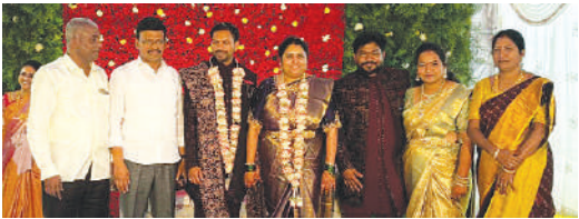
కొణిజర్ల, కెరటం న్యూస్ ప్రతినిధి