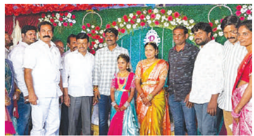
ఖమ్మం టౌన్, కెరటం న్యూస్