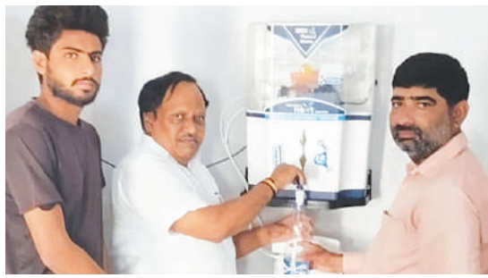
ఖమ్మం టౌన్, కెరటం స్కూల్స్