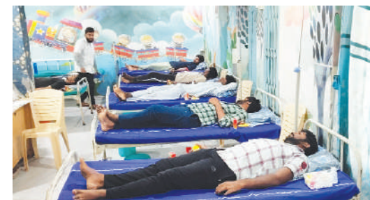
ఖమ్మం టౌన్, కెరటం స్కూల్స్