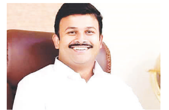
ఖమ్మం బ్యూరో, కెరటం స్కూల్స్