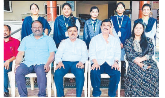
ఖమ్మం ఎడ్యుకేషన్, కెరటం స్కూల్స్