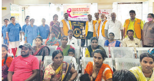
ఖమ్మంలో ఐఎంఐ క్యాన్సర్ స్క్రీనింగ్ క్యాంపు గ్రాండ్ సక్సెస్

ప్రపంచ క్యాన్సర్ దినోత్సవం సందర్భంగా ఖమ్మంలోని శ్రీదేవీ సర్కిల్ హెంబా, వ లయన్స్ క్లబ్ ఉమ్మడిగా ఉచిత క్యాన్సర్ స్క్రీనింగ్ క్యాంపు నిర్వహించారు. ఈ క్యాంపును లయన్స్ క్లబ్