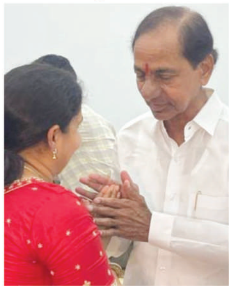
కార్యక్రమంలో పాల్గొన్నారు. ఈ సందర్భంగా ఆమె మాట్లాడుతూ... తెలంగాణ రాష్ట్రం సాధించడంలో కేసీఆర్ కారణజన్ముడిగా ప్రజల గుండెల్లో