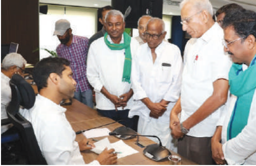
ఖమ్మం బ్యాంకు, కెరటం స్టూన్