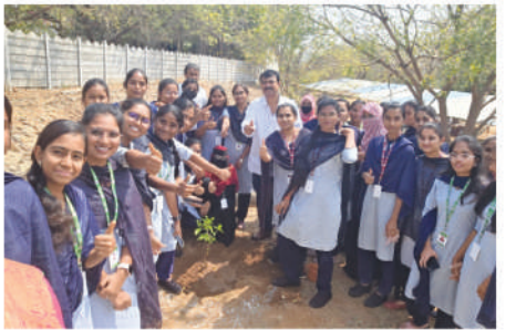
ప్రాణాలను సైతం లెక్కించక సాధించిన తెలంగాణ రాష్ట్రం దేశ రాజకీయాలలో పెను మార్పులు తీసుకువచ్చిందని వారు గుర్తు చేసారు. కే.సి.ఆర్. పాలనా కాలం రాష్ట్ర నిర్మాణంలో సువర్ణకాలంతో