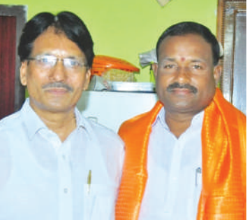
తీసుకోవాలని చర్యలపై నాయకులు ముచ్చటించుకున్నారు. రైతాంగ సమస్యల