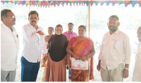
ఖమ్మం టౌన్