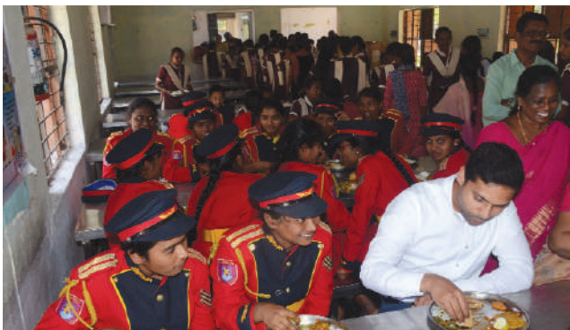
నిర్దేశించుకున్న లక్ష్యాన్ని ప్రతి రోజు గుర్తు తెచ్చుకోవాలని, జీవితంలో గొప్ప స్థాయికి ఎదిగిన తర్వాత మనం మరో 10 మందికి