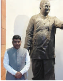
ఖమ్మం బ్యూరో, కెరటం న్యూస్

విశ్వ విఖ్యాత నటసార్వభౌమ, దివంగత మాజీ సీఎం తెలుగు ప్రజల ఆరాధ్య నటులు పద్మశ్రీ నందమూరి తారక రామారావు వర్గంతి