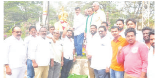
ఖమ్మం ఎడ్యుకేషన్, కెరటం న్యూస్