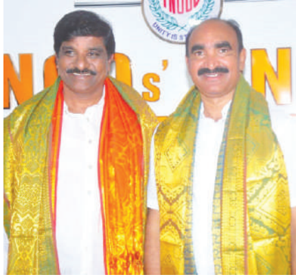
ఖమ్మం బ్యూరో, కెరటం న్యూస్