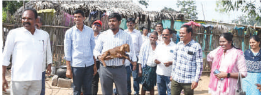
దుమ్ముగూడెం, కెరటం స్టూన్ ప్రతినిధి