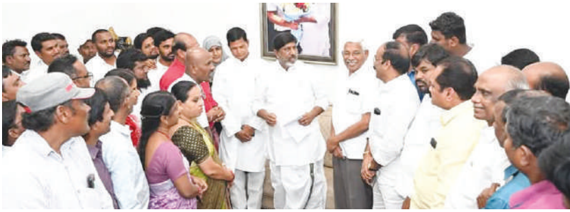
ఉద్యోగులు నెల రోజులుగా నిరసన చేస్తున్న విషయం విదితమే.. సమస్యల పట్ల సానుకూలంగా స్పందించిన డిప్యూటీ సీఎంఐ భట్టి విక్రమార్కు గారికి సర్వ శిక్షా అభియాన్ ఉద్యోగుల సంఘం ప్రతినిధులు కృతజ్ఞతలు తెలిపారు.