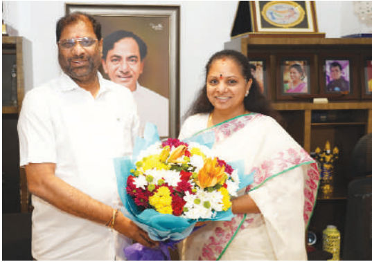
హైదరాబాద్ బ్యూరో, కెరటం న్యూస్

రాజ్యసభ సభ్యులు వద్దిరాజు రవిచంద్ర నూతన సంవత్సరం సందర్భంగా శాసనమండలి సభ్యురాలు కల్వకుంట్ల కవితను మర్యాదపూర్వకంగా కలిసి శుభాకాంక్షలు తెలిపారు. ఎంపీ రవిచంద్ర గురువారం రాత్రి కవిత నివాసానికి వెళ్లి పుష్పగుచ్ఛమిచ్చి శుభాకాంక్షలు చెప్పారు. భాకాంక్షలు రాజ్యసభ సభ్యులు వద్దిరాజు రవిచంద్ర నూతన సంవత్సరం సందర్భంగా శాసనమండలి సభ్యురాలు కల్వకుంట్ల కవితను మర్యాదపూర్వకంగా కలిసి శుభాకాంక్షలు తెలిపారు. ఎంపీ రవిచంద్ర గురువారం రాత్రి కవిత నివాసానికి వెళ్లి పుష్పగుచ్ఛమిచ్చి శుభాకాంక్షలు చెప్పారు.