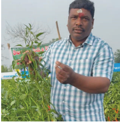
అనంతరం రైతులకు మంచి విందు భోజనం ఏర్పాటు చేశారు.