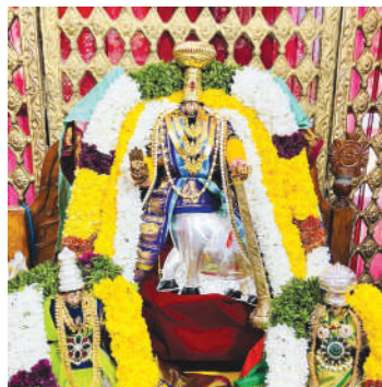
దుమ్ముగూడెం కెరటం న్యూస్

ముక్కోటి ఉత్సవాలలో భాగంగా మూడవ రోజు పర్ణశాల ఆలయంలో సీతారామచంద్ర స్వామివారు వరాహావతారం లో భక్తులకు దర్శనం ఇచ్చారు. మధ్యాహ్నం సాంస్కృతిక