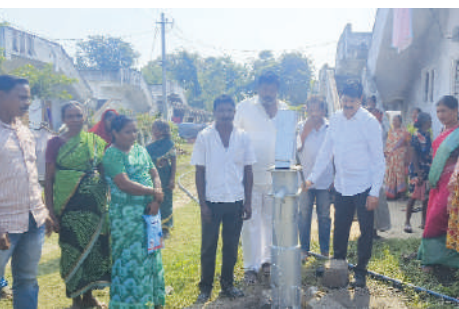
కెరటం న్యూస్ ప్రతినిధి దుమ్ముగూడెం నవంబర్ 18: దుమ్ముగూడెం మండల పరిధి లో భాగంగా సోమవారం భద్రాచలంఎమ్మెల్యే డాక్టర్ తెల్లం