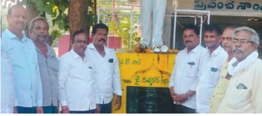
చింతకాని, కెరటం స్టూన్ ప్రతినిధి