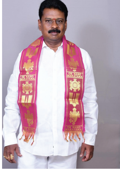
ఆత్మ బలిదానం గావించి ఆంధ్రప్రదేశ్ రాష్ట్రాన్ని సాధించి తెలుగు వారి ఆత్మగౌరవాన్ని కాపాడిన