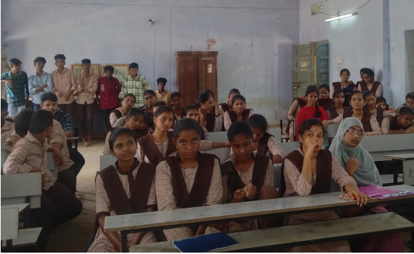
• ఎస్ఎఫ్ఐ మాజీ రాష్ట్ర కమిటీ సభ్యులు అన్నవరపు