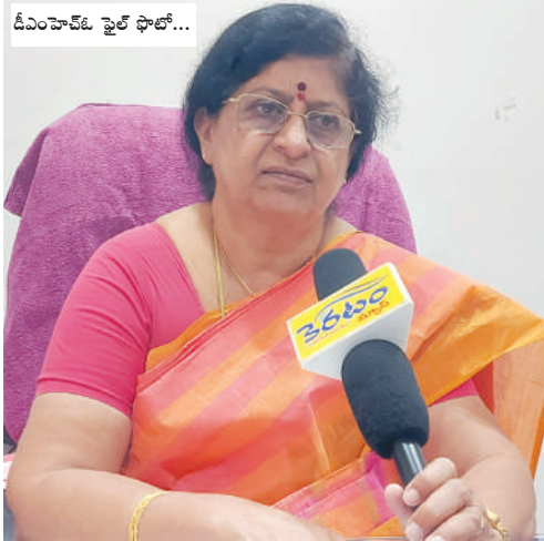
డీఎంహెచ్ఓ పై ఫోన్లో...

కీలకాంశాలను పరిశీలిస్తే... ఖమ్మం డియంహెచ్ఓ మాత్రం గత నాలుగేండ్లకంటే అవినీతి, అక్రమాలకు, ఉద్యోగులపై కక్ష సాధింపులకు పాల్పడుతున్నారని వస్తున్న ఆరోపణలపై బహిరంగ, సమగ్ర విచారణ జరిపి చర్యలు తీసుకోవాలంటూ ఫిర్యాదులో ప్రధానంగా పేర్కొన్నారు. ఖమ్మం జిల్లాలో, ఖమ్మం పట్టణంలో కొన్ని ప్రయివేట్ ఆసుపత్రులు నియమ నిబంధనలకు విరుద్ధంగా నిర్వహించ బడుతున్నప్పటికీ డి.యం.హెచ్ఓ పెద్దమొత్తంలో లంచాలు తీసుకుంటూ నిశబ్దంగా ఉంటున్నారనీ, ఖమ్మంలో కొందరు వైద్య రంగానికి చెందని వారు హాస్పిటల్స్ నిర్వహిస్తూ వైద్యాన్ని వ్యాపారం చేస్తున్నా చర్యలు తీసుకోవడంలో విఫలం అవుతున్నారని పేర్కొన్నారు. రాష్ట్రం నుండి వచ్చే అధికారులకు 2019నం. నుండి 2023.నం. వరకు కల్పించిన వసతి, భోజన, సౌకర్యాలకు రాసిన ఖర్చు లక్షల్లో అవినీతి జరిగిందనీ, 2019.నం. నుండి 2023. వరకు యన్ హెచ్ యం నిధుల ఖర్చులో యాభై శాతం ధనం అవినీతి, దుర్వినియోగం జరిగిందనీ పేర్కొన్నారు. 2019.నం. నుండి 2023 వరకు తీసుకున్న అద్దె వాహనాలు, ప్రయాణ కార్యక్రమాలు, సంధ్య అనే మలేరియా అధికారి వాహనం లేకుండానే ఖర్చులు డ్రా, డి.యం.హెచ్ఓ. వారి సొంత వాహనం (బీనామీ), దాని వాడకం లేకుండానే ఖర్చులు, ఆర్మియస్కి పథకంలో రూ. లక్షల్లో డ్రా చేశారని కలెక్టర్ కు ఫిర్యాదు చేసిన లేఖలో స్పష్టం చేశారు.