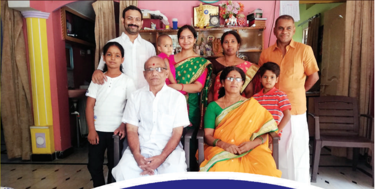
వనం నాగయ్య, కెరటం న్యూస్