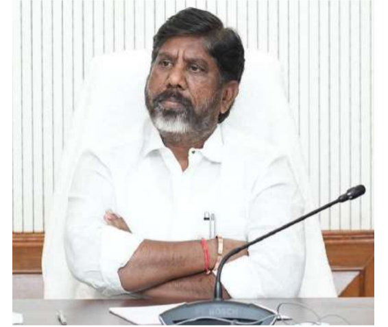
తెలంగాణ రెవెన్యూ, గృహ నిర్మాణం, సమాచార శాఖల మంత్రి పొంగులేటి శ్రీనివాసరెడ్డి పేర్కొన్నారు. కూసుమంచి మిగతా 2లో..