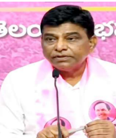
ప్రార్థించారు. ఆయన మన మధ్య సజీవంగా లేకున్నా ఆయన స్థాపించిన సంస్థల