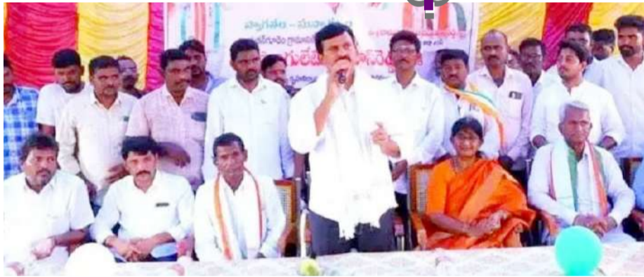
ఖమ్మం జ్యూరో, కెరటం న్యూస్ అర్చనలైన పేదలందరికీ మొదటి విడతలో ఇళ్లు....రెండో విడతలో ఇళ్ల స్థలాలు ఇస్తామని