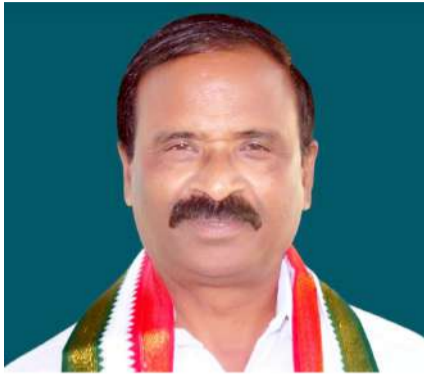
తెలుగువారి కీర్తిని దేశ స్థాయిలో చాటిన వ్యక్తిగా జిల్లా కాంగ్రెస్ కమిటీ అధ్యక్షులు