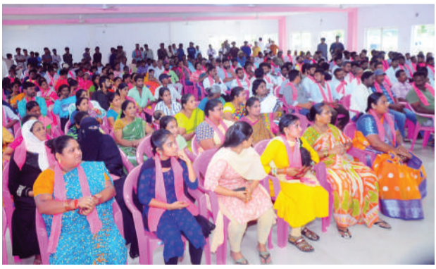
వికీత్పలు, ఇలా పలు సేవా కార్యక్రమాలు చేసి నామ సహాయానికి చిరునామాగా నిలిచారు.

ఖమ్మం ఎంపీగా నామ నాగేశ్వరరావు రెండు పర్యాయాలు... పదేళ్ల కాలంలో పూర్వ ఖమ్మం జిల్లా రూపురేఖలు మార్చారు. ఖమ్మం ఎంపీగా ప్రజలు కల్పించిన అవకాశాన్ని ఎంపీ నామ జిల్లా ప్రజల ప్రగతి, అభ్యున్నతికోసం వినియోగించి ఖమ్మం పార్లమెంట్ నియోజకవర్గాన్ని అన్ని రంగాల్లో ఉత్తమంగా తీర్చిదిద్దారు. పదేళ్లలో వేల కోట్ల నిధులను కేంద్ర, రాష్ట్ర ప్రభుత్వాల నుంచి తెప్పించి ఖమ్మం జిల్లాను ప్రగతి పథంలో నిలిపారు. రోడ్లు, వంతెనలు, రైల్వే లైన్లు, గ్రామీణ ప్రాంతాల అభివృద్ధి, సాగునీటి ప్రాజెక్టుల నిర్మాణం చేపట్టారు. ఎంపీగా, పార్లమెంటరీ పార్టీ నాయకుడిగా నామ నీతి, నిజాయితీగా పని చేస్తూ దేశంలోనే ఆదర్శ ఎంపీగా నిలిచారు. ఖమ్మం ప్రజలు, తెలంగాణ వాణిని పార్లమెంటులో వినిపించి సమస్యలను పరిష్కరించారు. నిరుద్యోగులకు జాబ్స్ కాలనీ ద్వారా ఉపాధి బాట చూపించి, నామ ముత్తయ్య (బ్రహ్మ, బసవతారక క్యాన్సర్ ఆసుపత్రి (బ్రహ్మ ఆధ్వర్యంలో రోగులు, ఆపన్నులకు ఎన్నోసార్లు సేవా కార్యక్రమాలు చేశారు. ఎంపీ నామ పదేళ్ల ప్రోగ్రెస్ రిపోర్టును చూసి ఖమ్మం ప్రగతి కోసం మరోసారి నామాను ఎంపీగా ఖమ్మం పార్లమెంటు స్థానం నుండి గెలిపించి డిల్లీకి పంపించాలనే లక్ష్యంతో ఈ ఎన్నికల ప్రచారం ఆయనకు ప్రజలు ఘనంగా స్వాగతం పడుతుండడం విశేషం.