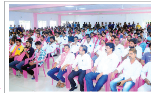
వికీత్పలు, ఇలా పలు సేవా కార్యక్రమాలు చేసి నామ సహాయానికి చిరునామాగా నిలిచారు.