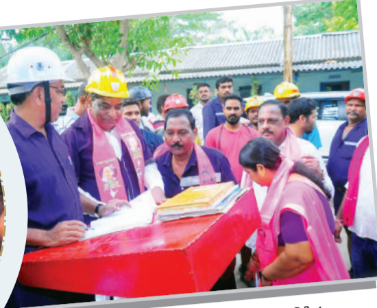
వికీత్పలు, ఇలా పలు సేవా కార్యక్రమాలు చేసి నామ సహాయానికి చిరునామాగా నిలిచారు.

ఖమ్మం ఉమ్మడి జిల్లాలో, రాష్ట్రంలో నామ ముత్తయ్య (బ్రహ్మ ఆధ్వర్యంలో నామ నాగేశ్వరరావు ఎన్నో సేవా కార్యక్రమాలు చేపట్టారు. కోట్లాది రూపాయలు తన సొంత నిధులతో మెరిట్ విద్యార్థులకు ఆర్థిక సహాయం, విద్యార్థులకు ల్యాప్టాప్ల పంపిణీ చేసి ఆదర్శంగా నిలిచారు. నామ ముత్తయ్య (బ్రహ్మ ద్వారా జాబ్స్ కాలనీ నిర్వహించి వేలాది దేశం లోనే ఆదర్శ ఎంపీగా పార్లమెంటులో నామ ఖమ్మం వాణిని వినిపించారు. పదేళ్లలో 690 ప్రశ్నలు సంధించడంతో పాటు పలు అంశాలపై పార్లమెంటులో మాట్లాడారు. కేంద్ర మంత్రులకు ఎంపీ నామ వందలాది లేఖలు రాయడంతో పాటు కేంద్ర నిధుల కోసం కేంద్ర మంత్రులను కలిసి పథకాలు మంజూరు చేయించారు. మందికి ఉద్యోగ ఉపాధి అవకాశాల కల్పన, దివ్యాంగులకు ట్రై సైకిళ్ల పంపిణీ చేశారు. ట్యాంకర్ల ద్వారా మంచినీటి సరఫరా, నిరుపేద రోగులకు ఆర్థిక సహాయం అందించారు. వందలాది దేవాలయాలు, చర్చిలు, మసీదుల నిర్మాణానికి గ్రాన్టేట్, ఆర్థికసాయం, లక్షకు పైగా ఆటో డ్రైవర్లకు ఖాకీ చొక్కాలు పంపిణీ చేసి కార్మిక పక్షపాతిగా నిరూపించుకున్నారు. వరదలు, కరోనా సమయంలో ప్రజలకు నేనున్నానంటూ సహాయ కార్యక్రమాలు చేశారు. అగ్ని ప్రమాదాల్లో బాధితులను ఆదుకోవడం, క్యాన్సర్ రోగులకు వైద్య