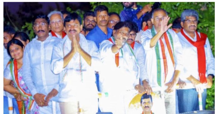
బీజేపీ, బిల్ ఎస్

రాయబోతున్నామని ఆ పార్టీ ఖమ్మం పార్లమెంట్ అభ్యర్థి నామ నాగేశ్వరరావు పేర్కొన్నారు. ముదిగొండ లో ఎన్నికల ప్రచారంలో భాగంగా సోమవారం నామ గారు మిగతా 2లో..