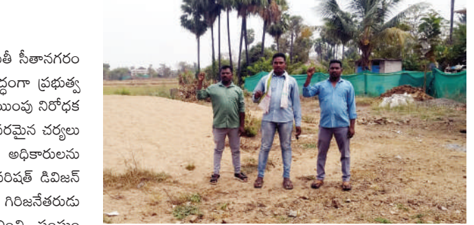
నిర్మాణం కొనసాగించే ప్రయత్నం తాత్కాలికంగా రేకుల షెడ్యూ నిర్బంధించి మట్టి ఇసుక తోలిచడం జరిగిందని బహిరంగంగా ఇంత జరుగుతున్న ఏజెన్సీ చట్టాలను అమలు చేయవలసిన రెవెన్యూ అధికారులు గానీ గ్రామపంచాయతీ అధికారులు గానీ అటువైపు తొంగి చూడకపోవడం విమర్శించారు ఉండని అన్నారని గిరిజనేతరుడు