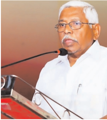
రాయితీ ఇప్పటికే అమలు లో ఉన్నదని కానీ అది కూడా సరిగా అమలు కావటం

కెరటం న్యూస్ ఖమ్మం : విద్య,వైద్యం వంటి కనీస అవసరాలు కూడా లేక జర్నలిస్టులు అనేక అవస్థలు పడుతున్నారని జనసమితి వ్యవస్థాపకులు తెలంగాణా సాధకుడు, సనమండలి సభ్యులుగా ఇటీవలే నామినేట్ అయిన కోదండరాం అన్నారు. డిజిఎఫ్ జాతీయ మహాసభ కు ముఖ్య అతిథి గా విచ్చేసిన ఆయన జర్నలిస్టుల సమస్యలపై స్పందించారు. జర్నలిస్టుల పై ప్రభుత్వాలు సానుకూలంగా ఉండాలన్నారు. వారికి విద్య వైద్యం తో పాటు వారికి నివాస యోగ్య మైన స్థలాల కేటాయింపులు జరగాల్సి ఉందన్నారు. కార్పొరేట్ విద్యాల యాలలో జర్నలిస్టులకు 50 శాతం