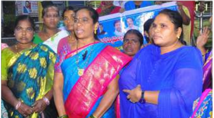
ఖమ్మం టౌన్, కెరటం స్టూన్