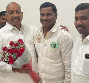
గత పాలకుల హయాంలో విలీన గ్రామపంచాయతీ డివిజన్ లు అభివృద్ధికి నోచేసలేదని, ఖమ్మం కార్పొరేషన్ లో స్వతంత్ర అభ్యర్థిగా పోటీ చేసి గెలుపొందిన తనపై రాజకీయ కక్షతో తన 3వ డివిజన్ కు మాజీ మంత్రి పువ్వాడ అజయ్ కుమార్ గారు, బిఆర్ఎస్ ప్రభుత్వం ఏ మాత్రం నిధులు కేటాయించలేదని తెలిపారు. గతంలో అధికారంలో ఉన్న బిఆర్ఎస్ పార్టీ ప్రతిపక్ష