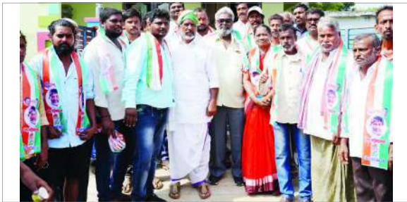
ఖమ్మం టౌన్

కాంగ్రెస్ పార్టీ మద్దర నియోజకవర్గ అభ్యర్థి భట్టి విక్రమార్కు ప్రచారానికి చింతకాని మండలంలో ఆహ్వాన్యమందన లభిస్తోంది. ఇంట్లు, ఇంటి స్థలాలు ఇప్పించిన భట్టి కే మా మధ్యతు అంటున్న చింతకాని ప్రజలు విన్నవించారు. ముఖ్యంగా గాంధీ నగర్, అనంతసాగరం, బొప్పారం గ్రామాల్లో భట్టి ప్రచారానికి ఘన స్వాగతం లభించింది. ఎన్నికల ప్రచారంలో పెద్ద ఎత్తున పాల్గొన్న మహిళలు రైతులు యువకులు పార్టీ క్రేజులు పాల్గొన్నారు. ఈ సందర్భంగా భట్టి విక్రమార్కు మాట్లాడుతూ... విజయోత్సవ ర్యాలీని తలపిస్తున్న ఎన్నికల ప్రచార ర్యాలీగా ఉండన్నారు. అభిమాన నాయకుడి పై బంధిపూలు చల్లుతూ, హారతులు పడుతూ స్వాగతం పలుకారు. ఆహ్వాయంగా పలకరిస్తూ అందరికీ అభివ్రాదం చేస్తూ ప్రచారం చేస్తున్న భట్టి ముందుకు కదిలారు. ఎన్నికల ప్రచారంలో సీఎల్పీ నేత భట్టి విక్రమార్కు మాట్లాడుతూ... కొట్లాడి కోరి తెలంగాణ రాష్ట్రం తెచ్చుకున్నదే మనం భాగవదాలని ఉమ్మడి రాష్ట్రంలో కంటే మెరుగ్గా బతకాలని ఆ పరిస్థితులకు భిన్నంగా మన బతుకులు ఉంటే తెలంగాణ తెచ్చుకున్నది దేనిని ప్రశ్నించారు.