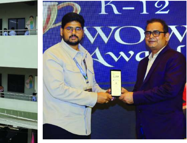
తన ప్రయోగాలతో నిర్వాహకులతో పాటు వేలాది మంది విద్యార్థుల మనసు గెలుచుకున్నారు.