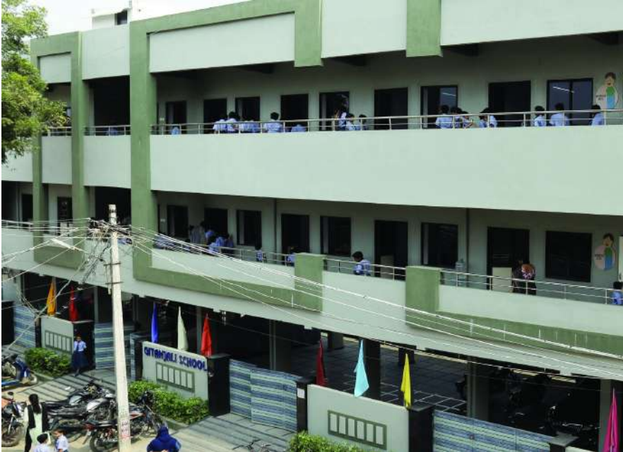
(4వ పేజీ తరువాయి..)

విద్యాలయాన్ని అందరూ విజ్ఞాన కాంతి పుంజం అని పిలుచుకుంటారు. క్యాంపెయిన్ తో పనిలేకుండా విద్యార్థుల తల్లిదండ్రులు ఆ పాఠశాల అర్డర్స్ వెతుక్కుంటూ వస్తారంటే అతిశయోక్తి కాదు. మూఠ్సంకూలను పారద్రోలి, కేవలం సైన్స్ అత్యంత ప్రాధాన్యతనిచ్చేలా విద్యార్థులను ఇంజనీర్లుగా, సైన్స్ ప్రయోగాలకు కేంద్ర బంధువులుగా మార్చిన ఆ పాఠశాల గొప్పతనం ఏంటో తెలుసుకోవాలనుండా.. అయితే ఒక్కసారి కెరటం న్యూస్ దినపత్రిక అందిస్తాన్న ఈ కథనం చదవాలిందే..