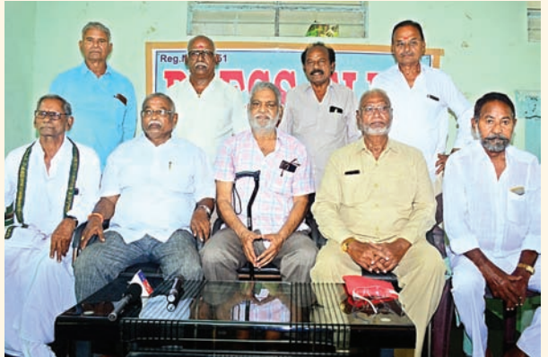
1969 తెలంగాణ ఉద్యమకారులను ప్రభుత్వం గుర్తించి వారి న్యాయబద్ధమైన