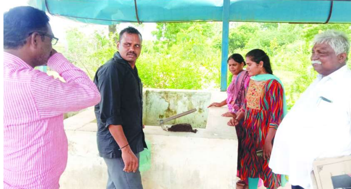
ప్రాంతంలో ఆయిల్ బాల్స్ వదులుట, గ్రామంలో బ్లీచింగ్ పొడిని విధానాన్ని, ఫాగింగ్ చేస్తున్న విధానాన్ని, డంపింగ్ షెడ్లు, క్రిమిటోరియాలు, నర్సరీలు, ఏవెన్యూ ప్లాంటేషన్, డివైడర్ ప్లాంటేషన్ మల్టీ లీయర్ ప్లాంటేషన్, పచ్చ ప్రకృతి వనాలను సంరక్షించారు.