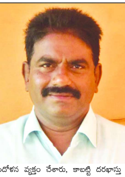
ఆందోళన వ్యక్తం చేశారు, కాబట్టి దరఖాస్తు