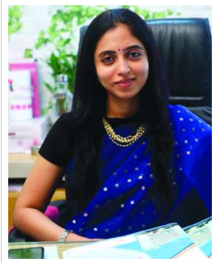
నమ్మకానికి చిరునామా బీలీఫ్ హాస్పిటల్స్..