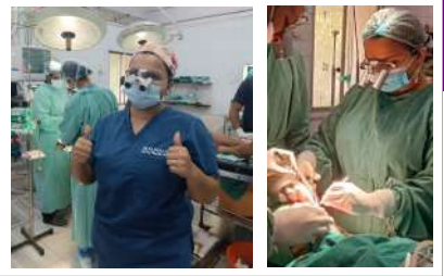
పద్దతులను అనుసరించి, అనుకోకుండా జరిగిన ప్రమాదాల్లో తెగిపడిన చేతివేళ్లు, చేతులు, శరీర భాగాలను వైద్య విధానం ద్వారా సరాలు, రక్తనాళాలు, సూక్ష్మమైన భాగాలను పరిశీలించి సర్జరీ చేస్తారు దీనినే మైక్రో సర్జరీ అంటారు. ఇవన్నీ ఇప్పుడు ఖమ్మంలో అందుబాటులో ఉన్నాయని ఆమె తెలిపారు.