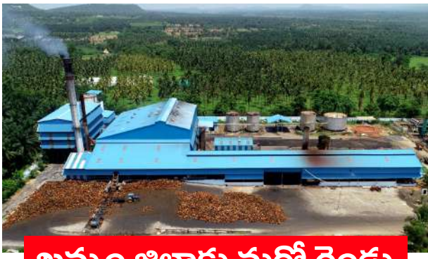
ఖమ్మం జిల్లాకు మరో రెండు