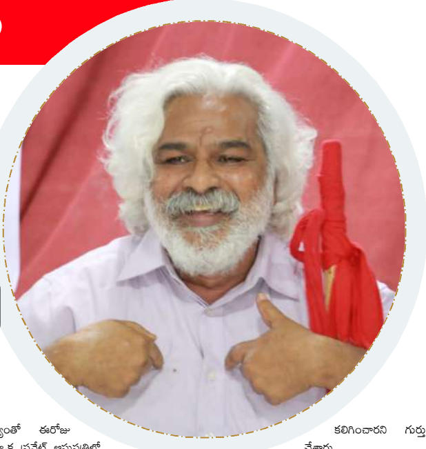
కలిగించారని గుర్తు చేశారు.