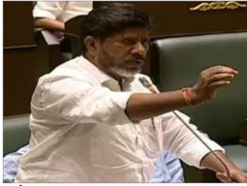
మాఫీయాగా మార్చాయని ద్వజమెత్తారు.

తెలంగాణ రాష్ట్రం వచ్చిన తరువాత రాష్ట్రంలో కార్పొరేట్, ప్రయవేలు పాఠశాల ఫీజుల దోపిడి ఉండదని, నారయణ, వైతన్య విద్య నర్సింగ్ దోపిడిని అరికట్టాలని ప్రగల్భాలు పలికిన బీఆర్ఎస్ పాలకులు తొమ్మిదిన్నర సంవత్సరాలు ఎన్ని విద్యాసంస్థల్లో ఫీజుల దోపిడిని అరికట్టారని నిలదీశారు. నాలయణ, వైతన్య లాంటి కార్పొరేట్ విద్య సంస్థలు అనుమతులు లేకుండా పాఠశాలను నడుపుతుంటే ఏం చేస్తున్నారని ప్రశ్నించారు. కార్పొరేట్ విద్యాసంస్థలు విద్యను