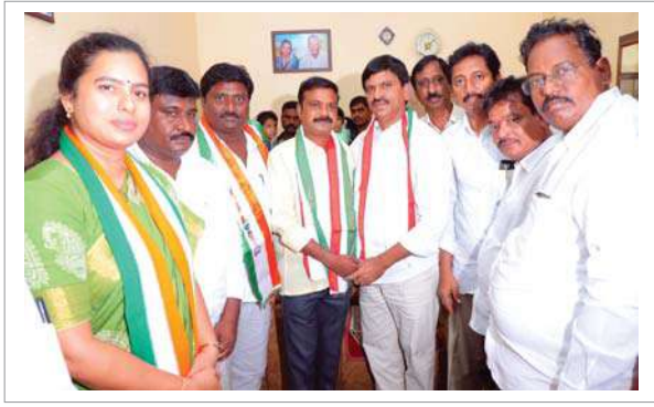
ఖమ్మం జ్యూరో, కెరటం న్యూస్