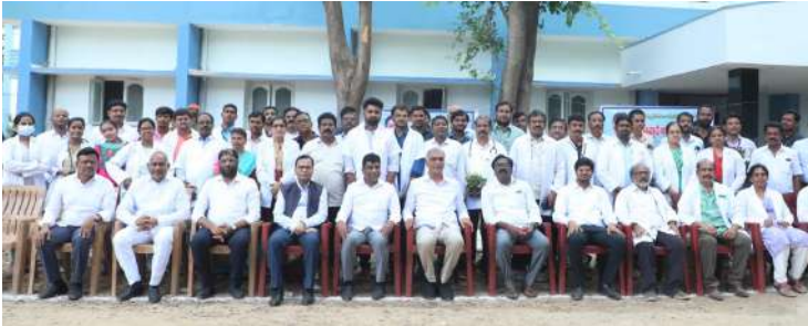
ఖమ్మం, జూన్ 30-వెరటం స్టూడెంట్స్

ఖమ్మం జిల్లా కేంద్రంలోని ప్రభుత్వ మెడికల్ కళాశాల లో ఈ విద్యా సంవత్సరం నుండి 100 సీట్లతో నిర్వహించనున్న కళాశాల తరగతులకు అన్ని ఏర్పాట్లు చేయాలని రాష్ట్ర వైద్య, ఆరోగ్య, కుటుంబ సంక్షేమ, ఆర్థిక శాఖల మంత్రి హరీష్ రావు అధికారులను ఆదేశించారు. శుక్రవారం భద్రాద్రి కొత్తగూడెం జిల్లా పాల్వంచలో పోడు భూమిల పట్టణం పంపిణీ అనంతరం హెలికాప్టర్ ద్వారా