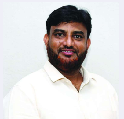
రాష్ట్రంలోని అభివృద్ధి సంక్షేమ పథకాలు