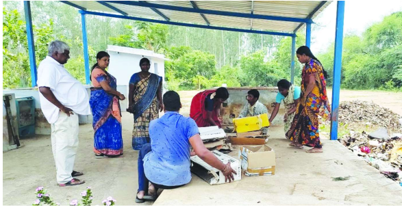
షేడ్ నెట్ సరి చేయాలి అని, విత్తనాలు మొలకెత్తని బ్యాగులలో కొత్త విత్తనాలు ఏర్పాటు చేయాలి

ప్రైడే ప్రైడేలో భాగంగా జెడ్పీ సీఈవో, చుంచుపల్లి మండల ప్రత్యేక అధికారిణి మెరుగు విద్యాలత శ/క్రవారం రుద్రంపూర్, గౌతమ్పూర్ గ్రామపంచాయతీలను పర్యటించుట జరిగినది. గౌతమ్పూర్ గ్రామపంచాయతీలో ప్లాస్టిక్ వేస్ట్ మేనేజ్మెంట్ యూనిట్ నిర్మాణానికి స్థల పరిశీలన చేయుట, గోవర్ధనగిరి బయ్యగూస్ ఫ్లాంట్ యూనిట్ కొరకు స్థల పరిశీలన చేశారు. అదేవిధంగా డంప్ షెడ్ నందు సిగ్నలింగ్ జరుగు విధానం సేంద్రీయ ఎరువు తయారు చేయు విధానం పరిశీలించి కొన్ని సూచనలు చేశారు. తదుపరి రుద్రంపూర్ గ్రామపంచాయతీ సర్పంచీ సంధర్శించి సర్పంచీ కోతుల పల్ల చినిగిపోయిన