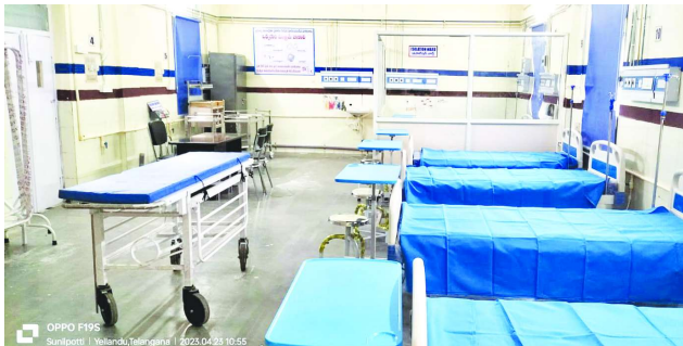
భద్రాచలం ఆసుపత్రి నందు 10 మెషిన్లతో డయాలసిస్ సేవలు అందిస్తున్నామని చెప్పారు. డయాలసిస్ రోగులకు ఈ రెండు కేంద్రాలు సరిపోక చాలా మంది వ్యాధిగ్రస్తులు వంతులు కోసం వేచి ఉండాలని వరిస్థితి ఉండేదని, నిరీక్షించే వారని చెప్పారు. వ్యాధిగ్రస్తులకు సకాలంలో డయాలసిస్ సేవలు అందక ఇబ్బందులు పడుతున్నారని ప్రభుత్వం దృష్టికి తీసుకెళ్లగా అదనంగా మూడు

శామ్, మే 17(కరటం ప్రతినిధి) మణుగూరు, ఇల్లందులలో డయాలసిస్ కేంద్రాలు సిద్ధమైన్నట్లు జిల్లా కలెక్టర్ అనుదీప్ తెలిపారు. భద్రాద్రి కొత్తగూడెం జిల్లాకు మూడు డయాలసిస్ కేంద్రాలు మంజూరు కాగా అందులో రెండు కేంద్రాలు ప్రాంతీయ ఆసుపత్రి మణుగూరు, సామాజిక ఆరోగ్య కేంద్రం ఇల్లందులలో ప్రారంభించడానికి సిద్ధం చేశామని అతి త్వరలోనే డయాలసిస్ సేవలు అందుబాటులోకి రానున్నాయని ఆయన తెలిపారు. ప్రస్తుతం జిల్లాలోని కొత్తగూడెం ఆసుపత్రి నందు 5 మెషిన్లతో, ప్రాంతీయ ఆసుపత్రి