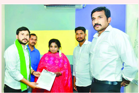
గవర్నర్ ను కలిసిన ఎల్.హెచ్.పి.ఎస్ నాయకులు

నూతన డయాలసిస్ కేంద్రాలు ప్రాంతీయ ఆసుపత్రి మణుగూరు, సామాజిక ఆరోగ్య కేంద్రం ఇల్లందు, సామాజిక ఆరోగ్య కేంద్రం అక్కారాపుపేటలో ఏర్పాటు చేయబడుతున్న విధులు మంజూరు చేసినట్లు ఆయన చెప్పారు. ఒక్కో కేంద్రానికి 50 లక్షల చొప్పున మొత్తం ఒక కోటి 50 లక్షలతో. మొత్తం మూడు నూతన కేంద్రాలు ఏర్పాటు చేస్తున్నట్లు చెప్పారు. ప్రతి కేంద్రంలో 5 డయాలసిస్ యంత్రాలతో వ్యాధి గ్రస్తులకు సేవలు అందుబాటులోకి రానున్నాయని తెలిపారు. నూతన కేంద్రాలు ఏర్పాటు ద్వారా డయాలసిస్ రోగులు డయాలసిస్ కొరకు భద్రాచలం, కొత్తగూడెం ఆసుపత్రులకు సుదూరం ప్రయాణం చేయకుండా స్థానికంగానే ఉచితంగా డయాలసిస్ సేవలు అందించనున్నట్లు ఆయన తెలిపారు. ఈ డయాలసిస్ కేంద్రాలు ఏర్పాటుతో వ్యాధి గ్రస్తులకు వ్యయ ప్రయాసల భారం తగ్గుస్తుందని ఆయన చెప్పారు. ఈ నెల చివరి వరకు సామాజిక ఆరోగ్య కేంద్రం అక్కారాపుపేట లో కూడా డయాలసిస్ కేంద్రం సేవలు అందుబాటులోకి తీసుకురానున్నట్లు చెప్పారు.