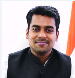
నీటి సంరక్షణలో జిల్లాకు జాతీయ స్థాయి అవార్డు