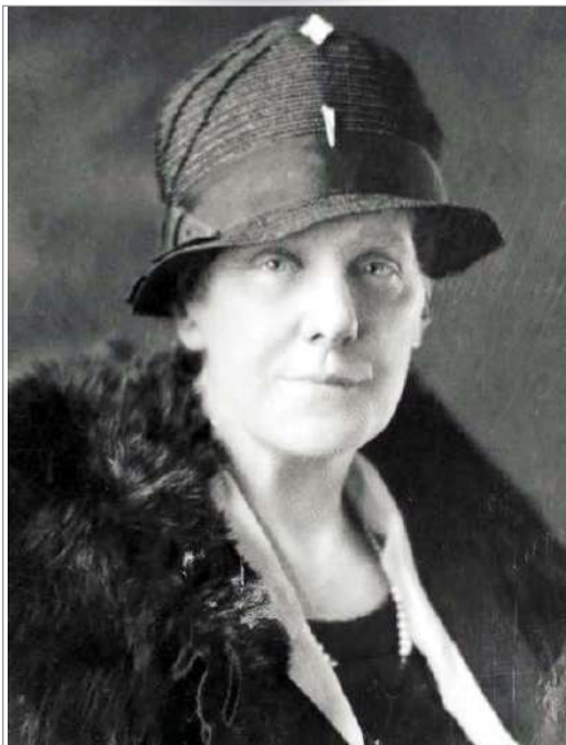
మదర్స్ డేకు అడుగులు పడింది ఇలా...

ఏదీ లేదు. అందుకే 'మాతృదేవో భవ' అని ద్వైపంతో సమానంగా అమ్మను కొలుస్తాం. అలాంటి అమ్మకు ఏమిచ్చి రుణం తీర్చుకోగలం. ఆ తల్లిని గౌరవించాలన్న ఆలోచనతో పుట్టినదే 'మదర్స్ డే'. ఎక్కడో అమెరికాలో మొదలైన ఈ సంప్రదాయం ఇప్పుడు ప్రపంచవ్యాప్తంగా జరుపుకునే స్థాయికి వెళ్లింది.