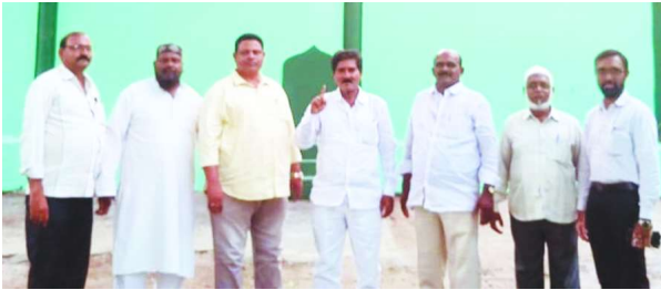
శామ్, ఏప్రిల్ 21 (తెలంగాణ ప్రతినది)