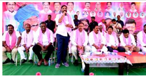
పసం నాగయ్య, కెరటం న్యూస్

తన 5 ఏళ్ల పదవీ కాలంలో జిల్లాకు ఏమీ చేయలే.. పదికి పది సీట్లు గెలిచి అసెంబ్లీలో అడుగుపెడతం అని పగటికలలు కంటున్నరు : ఎంపీ వద్దిరాజు రవిచంద్ర